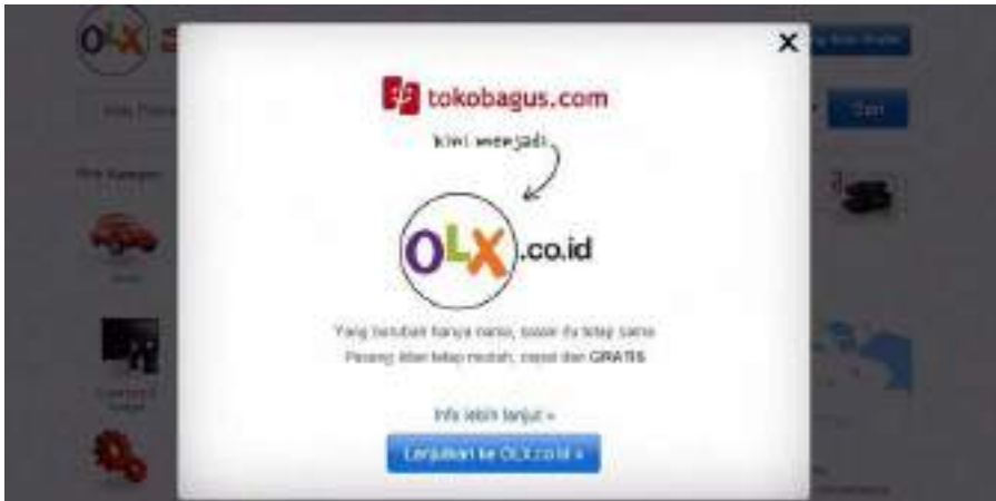
Gambar 1. Tampilan aplikasi OLX.co.id

perubahan pada nama, logo serta URL baru. Perubahan tersebut terjadi pada tahun 2014, sebagaimana dapat dilihat seperti gambar di bawah ini: